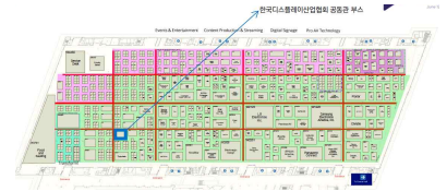
< 한국관 위치 >