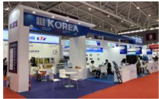
< '23년도 중국 C-Touch 전시회 한국공동관 조감도 및 전경 >