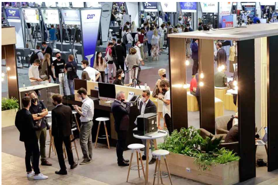
<스페인 MWC 정보>